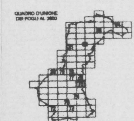
TAVOLA N° 84 SCALA 1/2000

Ufficio Tecnico: arch. Rodolfo Albisani Consulente: arch. Luisa Garassino