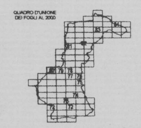
TAVOLA N° Capoluogo Ovest La Torre 80 SCALA 1/2000

Ufficio Tecnico: arch. Rodolfo Albisani Consulente: arch. Luisa Garassino