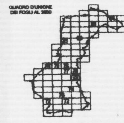
TAVOLA N° Salaiole s. Anzano 73 SCALA 1/2000

Ufficio Tecnico: arch. Rodolfo Albisani Consulente: arch. Luisa Garassino