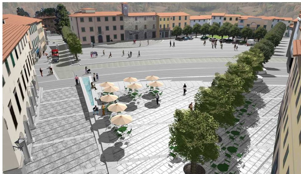
PIAZZA- Veduta da Nord